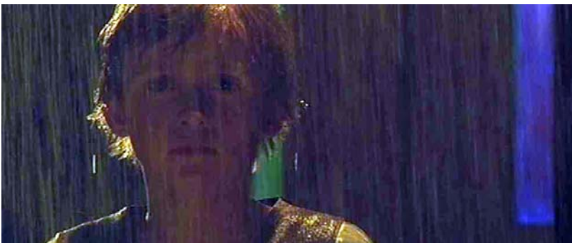
vorläufiges Ende einer Freundschaft

Diskutiere auffällige filmische Gestaltungsweisen!