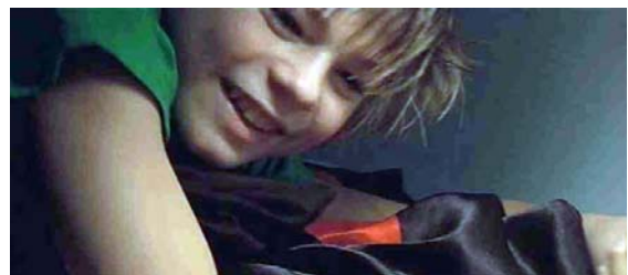
Das Spiel mit Licht